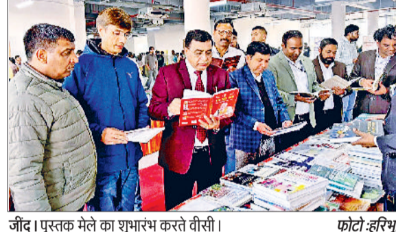
जींद। पुस्तक मेले का शुभारंभ करते वीसी।

के लिए जागरूकता एवं सतर्कता जरूरी है। यदि हम इस दिशा में थोड़ा सा भी ध्यान दें तो बड़े साइबर अपराध को रोक सकते हैं। इसके लिए अपने पासवर्ड मजबूत रखें। टू स्टैप वेरिफिकेशन जैसे विकल्पों पर ध्यान दिया जाए। उन्होंने विशेष रूप से एआई के बढ़ते प्रभाव पर चर्चा करते हुए कहा कि एआई का उपयोग एक सहायक उपकरण के रूप में करें, लेकिन इसके द्वारा जनित सूचना पर आंख मूंदकर विश्वास न करें और हमेशा तथ्यों की जांच करें। इस तकनीक का उपयोग सावधानी और जिम्मेदारी के साथ करें।