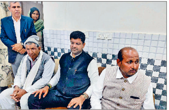
उचाना। कार्यकर्ता के आवास पर पहुंचे पूर्व डिप्टी सीएम दुष्यंत चौटाला।

पूर्व डिप्टी सीएम दुष्यंत चौटाला उचाना हलके के मंगलपुर, दोरौली खेड़ा, उचाना खुर्द, उचाना कलां, बड़ौदा, खटकड़ गांव में पहुंचे। हलके के गांव में कार्यकर्ताओं से रूबरू हुए व उनके दुख, सुख में शामिल हुए। दुष्यंत चौटाला ने कहा कि जिस प्रकार से हरियाणा के मुख्यमंत्री नायब सिंह सैनी पिछले दो हफ्तों से एक ही बात कह रहे हैं कि हमने सबसे ज्यादा पेंशन बढ़ाई। पहले तो यह जवाब दें कि जब से नायब सिंह सैनी ने शपथ ली है तब से क्या एक रुपए भी बुढ़ापा पेंशन प्रदेश में बढ़ी है। ना तो उन्होंने कोई पेंशन बढ़ाई बल्कि 40 हजार बुजुर्गों की पेंशन को काटने का काम किया और कहना है कि अभी कटी नहीं है