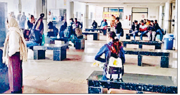
जींद। बस अड्डे पर मौजूद यात्री।

जींद से सुबह छह बजकर 40 मिनट पर चंडीगढ़ जाने वाली एसी बस को हटा कर अब सिरसा के लिए चलाया गया है। चंडीगढ़ रूट पर पिछले दिनों सात बजकर 50 मिनट पर बस शुरू की गई थी। इस कारण एसी बस में यात्रियों की संख्या कम होने लगी थी। ऐसे में सुबह छह बजकर 40 मिनट पर चंडीगढ़ जाने वाली बस को वहां से हटाकर अब सिरसा रूट पर लगाया गया है। जींद डिपो में इस समय दस एसी बस हैं। इसमें से एक