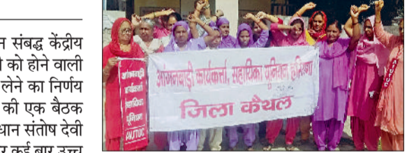
आंदोलन के बाद 975 वर्कर्स को बहाल तो कर दिया गया, लेकिन हड़ताल अवधि का भुगतान अभी तक नहीं मिला, जबकि सरकार ने बातचीत के दौरान इसका आश्वासन दिया था।