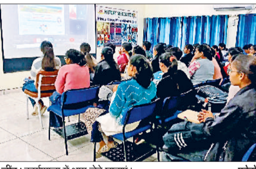
जींद। कार्यशाला में भाग लेते छात्राएं।