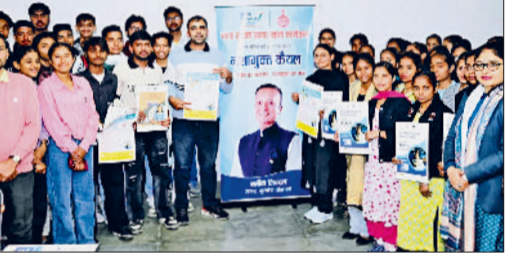
पूडरी। डी-एडिक्शन जागरूकता कार्यक्रम में भाग लेते विद्यार्थी।