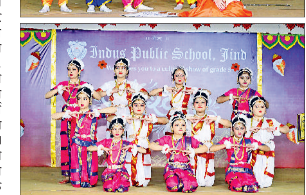
जींद। सांस्कृतिक कार्यक्रमों की प्रस्तुति देते बच्चे।