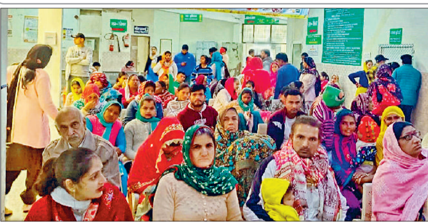
जींद। नागरिक अस्पताल में उपचार के लिए आई महिलाएं।